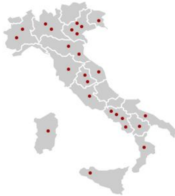
Figura 1- Distribuzione dei parchi tecnologici in Italia (figura presa dal sito dell'associazione parchi scientifici e tecnologici italiana, http://www.apsti.it/ )